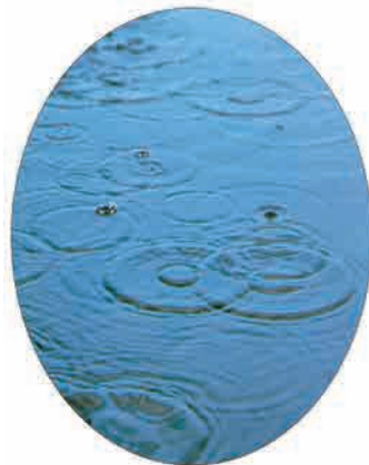
بارانِ نَمِ نَمِ