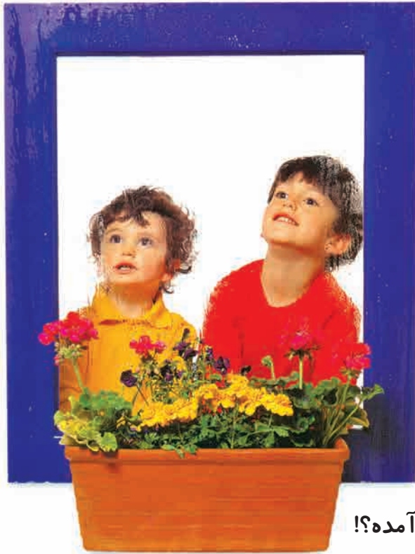
باران بند آمده؟!