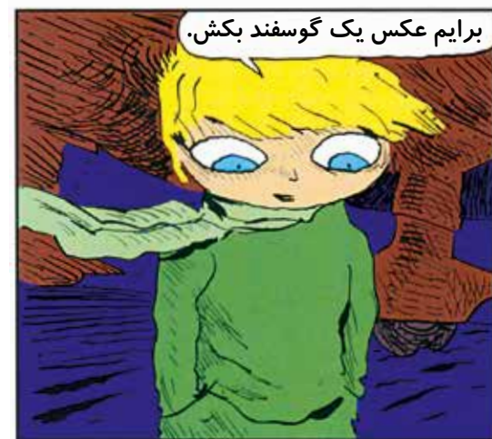
برایم عکس یک گوسفند بکش.