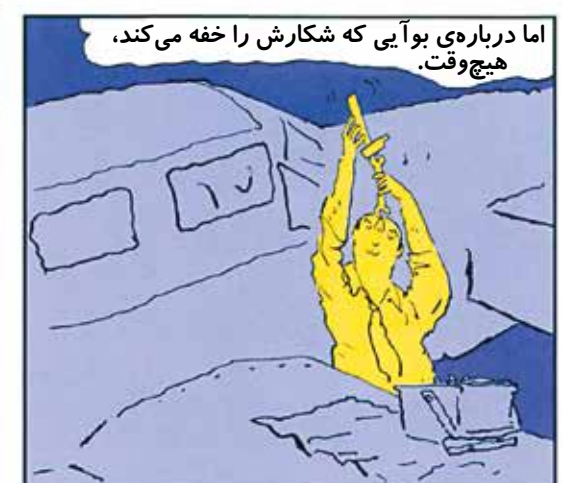
اما درباره ی بو آبی که شکارش را خفه می کند، هیچ وقت.