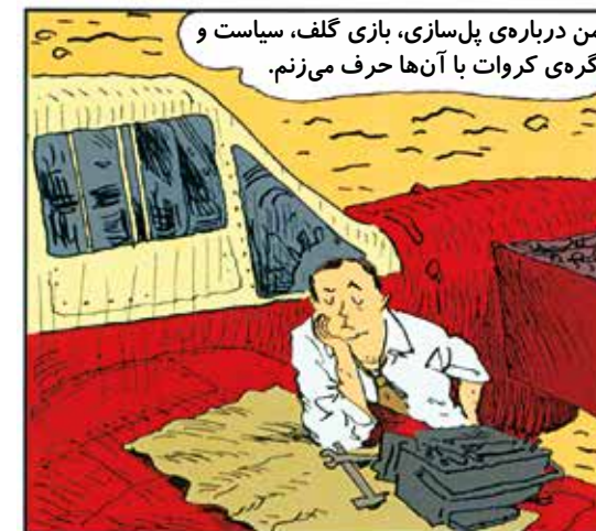
من درباره ی پل سازی، بازی گلف، سیاست و گره ی کروات با آنها حرف می زنم.