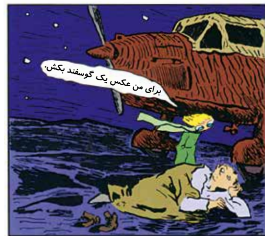
برای من عکس یک گوسفند بکش.