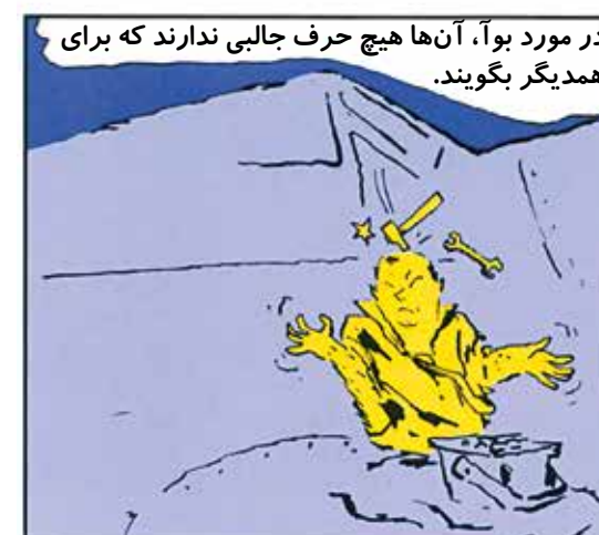
در مورد بو آ، آنها هیچ حرف جالبی ندارند که برای همدیگر بگویند.