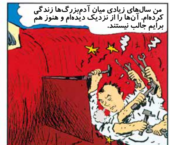
من سالهای زیادی میان آدم بزرگها زندگی کرده ام. آنها را از نزدیک دیده ام و هنوز هم برایم جالب نیستند.