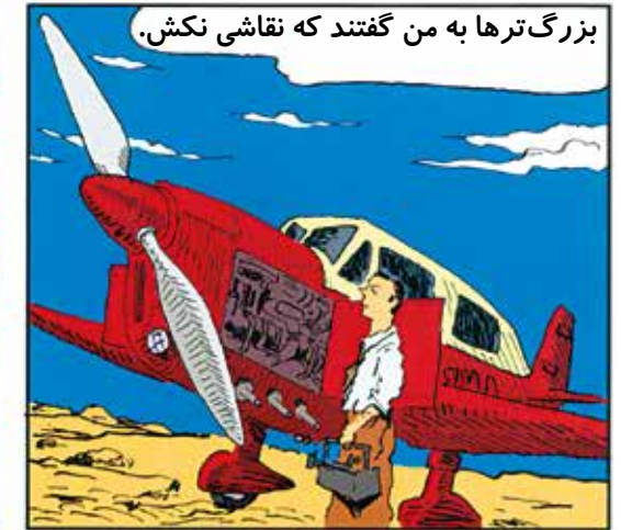
بزرگ ترها به من گفتند که نقاشی نکش.