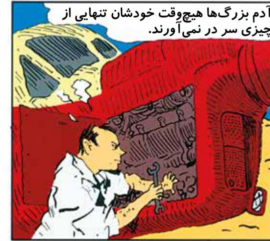
آدم بزرگها هیچ وقت خودشان تنهایی از چیزی سر در نمی آورند.