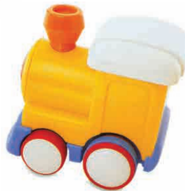
یک اسباب بازیِ قشنگِ رنگی