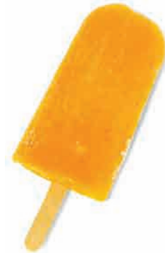
یک بستنی یخی