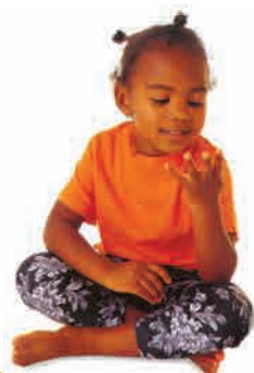
با انگشتانت بشمار! چهار!