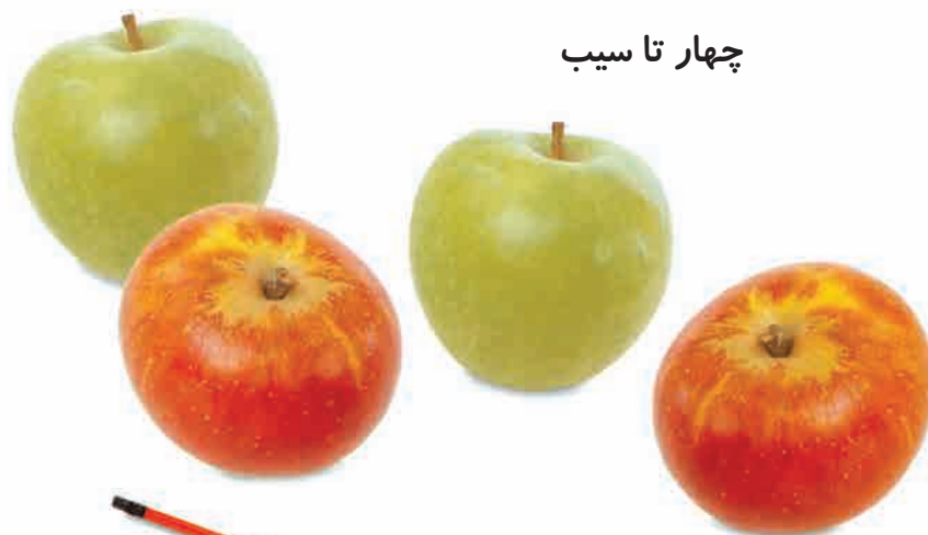
چهار تا سیب