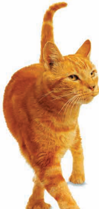
یک گربه... با یک دمِ دراز!