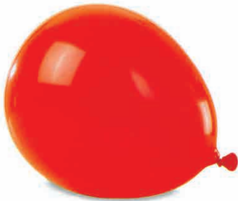
یک بادکنکِ براق

یک و یک و یک، دویدم یه خرسِ رنگی دیدم یک توپ و یک بادکنک، برای او خریدم