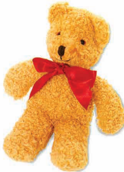
یک خرسِ عروسکی نرم