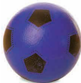
یک توپِ سبک