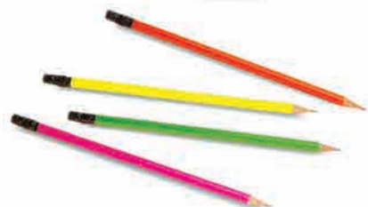
چهار تا مداد رنگی