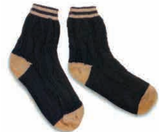
دو تا جورابِ پشمی