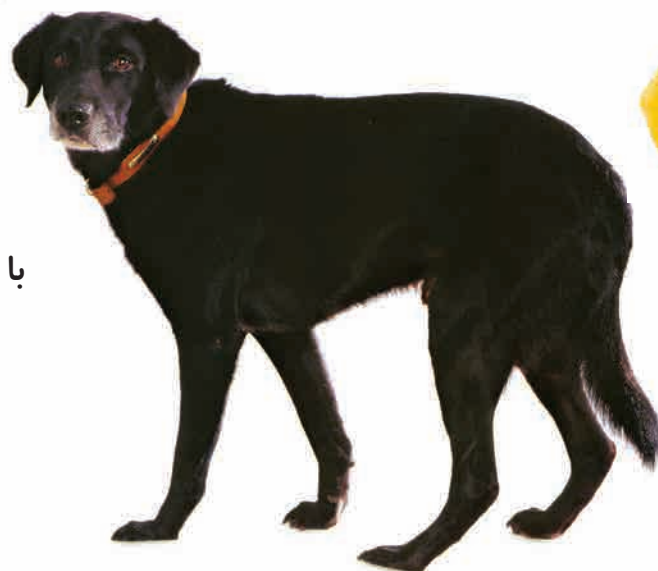
این آقا سگه چهار تا پا دارد!