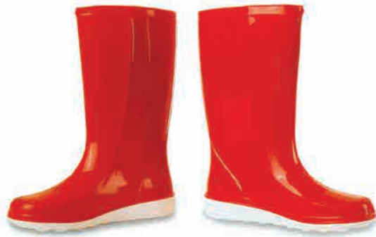
دو تا چکمه ضد آب