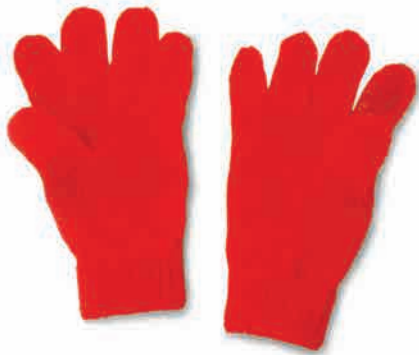
دو تا دستکش گرم و نرم

دو و دو و دو، بچه‌ها دو دست دارن، دو تا پا دو تا دستکش و چکمه می‌پوشن توی سرما