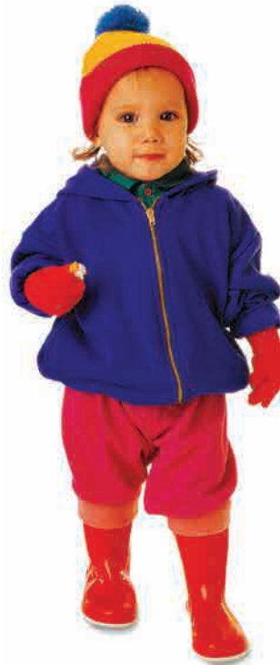
تو، دو تا چشم، دو تا گوش، دو تا دست و دو تا پا داری! نگاه کن!