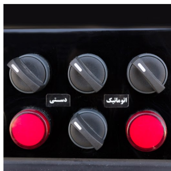
کلید خاموش و روشن موتور ها