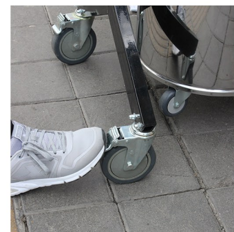
چرخ های صنعتی قفل دار

جاروبرقی صنعتی گرین به همراه سه موتور اتوماتیک با توان ۱۲۵۰ وات ساخته شده توسط کمپانی Amitec با قابلیت مکش کامل آب و خاک و امکان کارکرد جداگانه، همزمان و ترکیبی موتور ها. مخزن ۹۵ لیتری با قابلیت نگه داری آب و خاک. دارای فیلتر مخصوص قابل تعویض و شستشو، به منظور جلوگیری از ورود آب و خاک به محفظه موتور سیستم تخلیه زباله بدون دردر برداشتن کگی. کلید و کابل صنعتی. چرخ های صنعتی قفل دار. سیم اتصال ۱۰ متری با کیفیت. ساخت ایران.