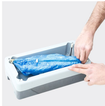
محل قرارگیری کاور کفش