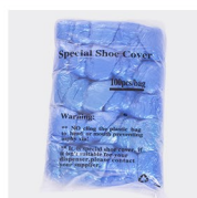
کاور کفش T شکل