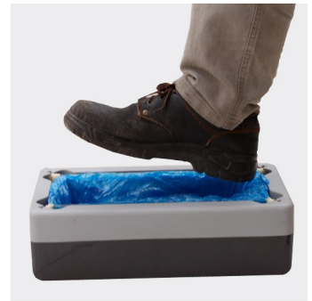
محل قرار گیری کفش

دستگاه کاور کفش گرین با کارکرد مکانیکی . طراحی بدنه زیبا ساخته شده از کائوچو (پلاستیک فشرده) ، دارای ابعاد کوچک و وزن مناسب جهت سهولت در جابه جایی با ظرفیت کاور گیری ۵۰ عددی ، جای گیری راحت کاور کفش ، استفاده سریع و آسان، هزینه تعمیر و نگهداری بسیار پایین ، کمترین میزان خطا ، قیمت مناسب ، بدون نیاز به برق و باتری ، دسترسی راحت به قطعات ، دارای حداکثر ایمنی در قسمت کاور کردن کفش محصولی مناسب برای مکان های کم تردد کرده است.