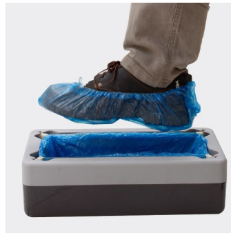
کاور کردن کفش