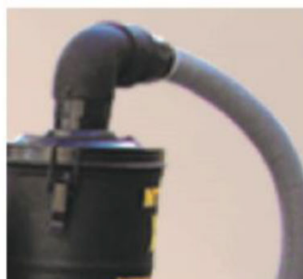
کوبل گردان ۳۶۰ درجه به منظور سهولت در استفاده