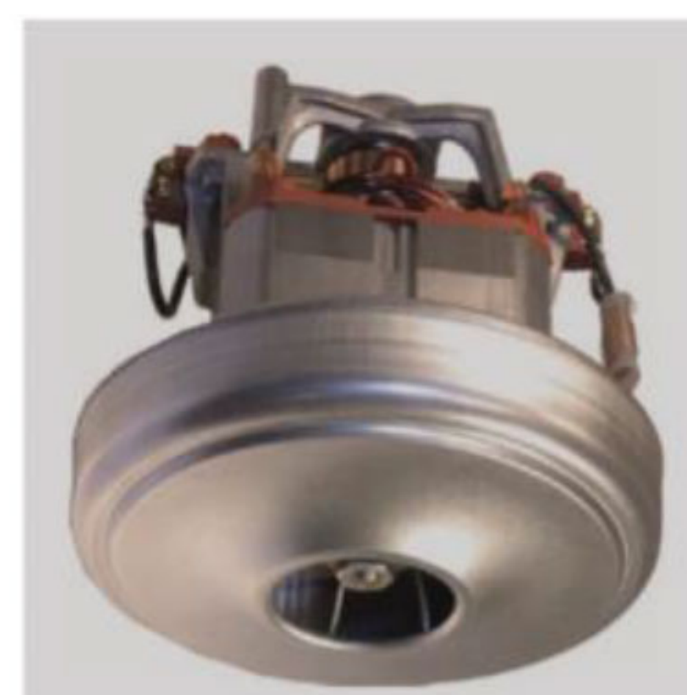
دارای یک موتور ۱۲۰۰ وات تک پروانه ای