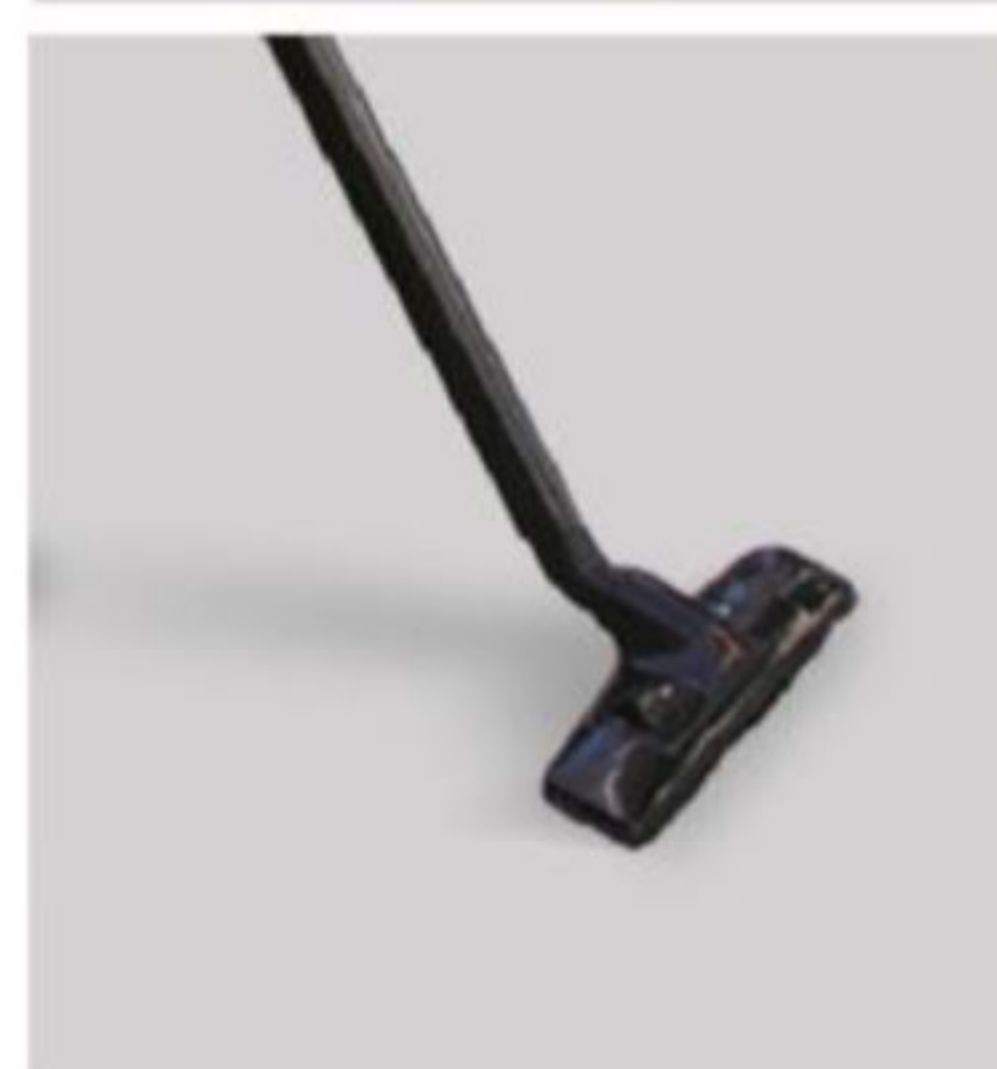
اتصالات مرغوب و بادوام