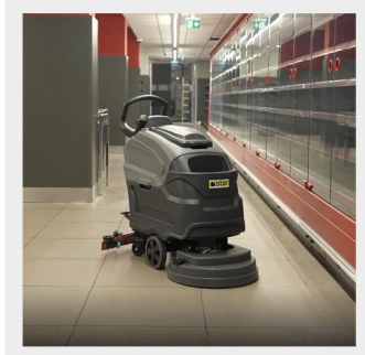
مناسب فضاهای وسیع

شستن اصولی کف زمین توسط دستگاه های کفشوی صنعتی (اسکرابر) انجام میشود. این دستگاه ها توسط فرچه تمام کثیفی ها را شسته و توسط تی مکنده آن راجمع آوری می کند. دستگاه مدل 5100B ساخت شرکت STAR ترکیه است و دارای کیفیت ساخت مطلوبی می باشد. این مدل برای فضای 1000 الی 4000 متر مربع مناسب است. کارکرد با باتری 24 ولت 100 آمپر است. این مدل دارای مخزن آب تمیز 47 لیتر و مخزن جمع آوری 50 لیتری می باشد. با توجه به مخازن بزرگ فضای زیادی را با یکبار پر کردن تمیز می نماید. مخزن کثیف قابلیت جدا شدن و تخلیه و تمیز کردن است.