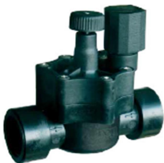
باز و بسته شدن دستی